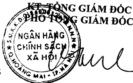
Nguyễn Văn Lý